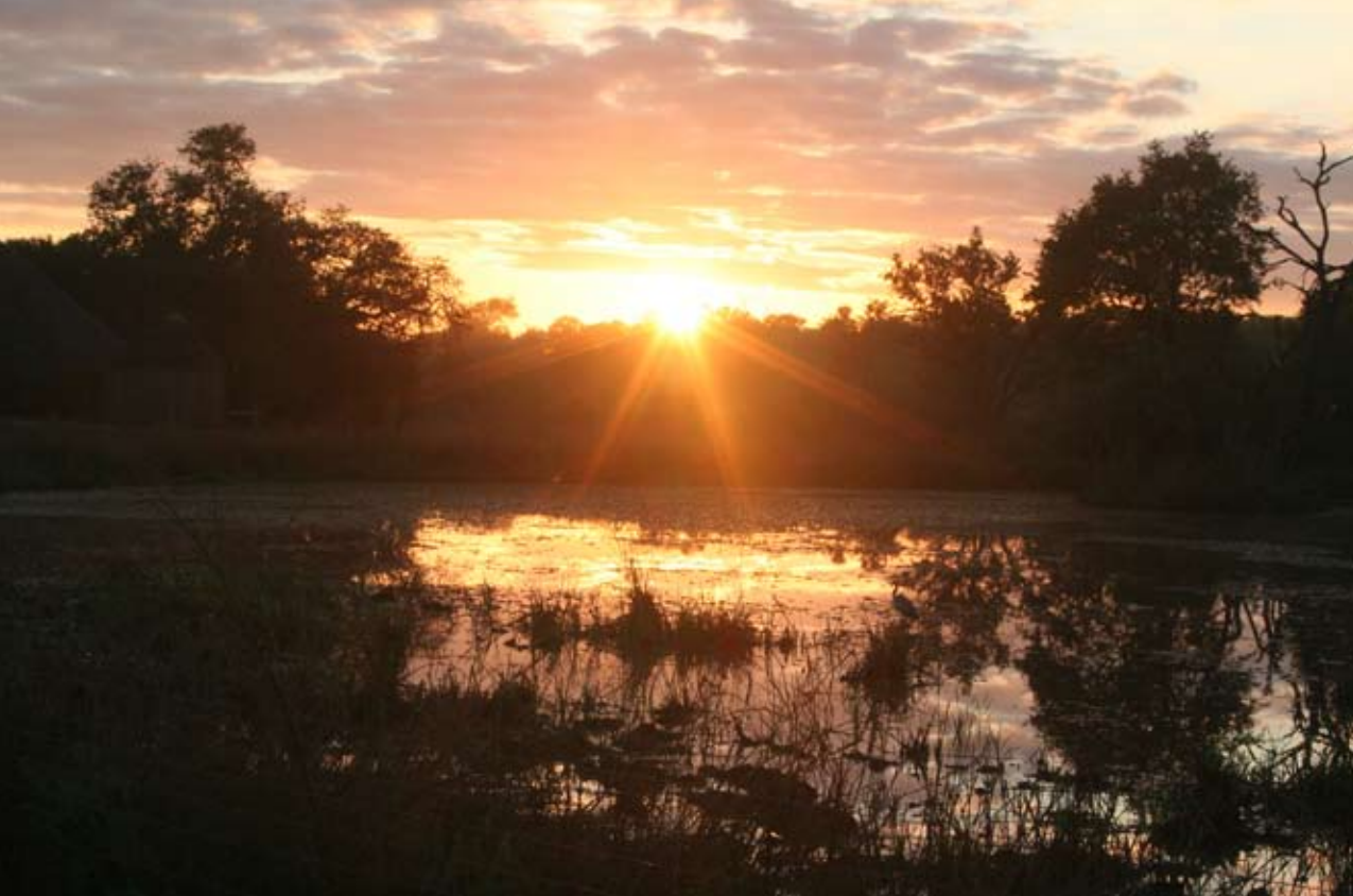
I slutten av oktober må du ut av køya klokka fem på morgenen hvis du skal få med deg den stemningsfulle soloppgangen.