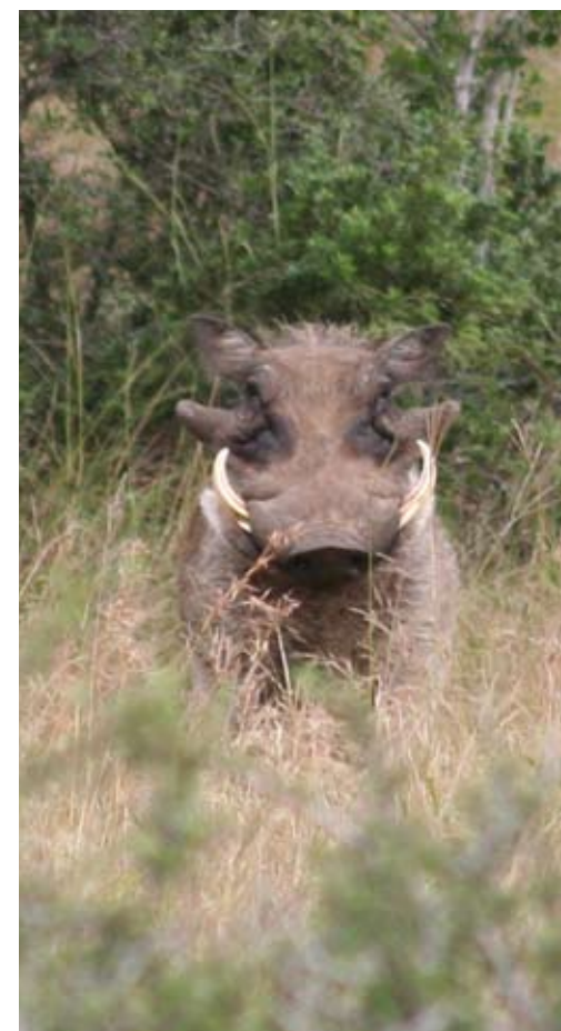
Vortesvinet dukket opp fra sitt hvilested i krattet, men heldigvis for galten hadde jegeren annet jaktørend denne dagen!

– You will take him next time, trøster Denham og lager en liten glippe mellom tommel og pekefinger. Det betyr hårfin bom. Det mislykkede skuddet