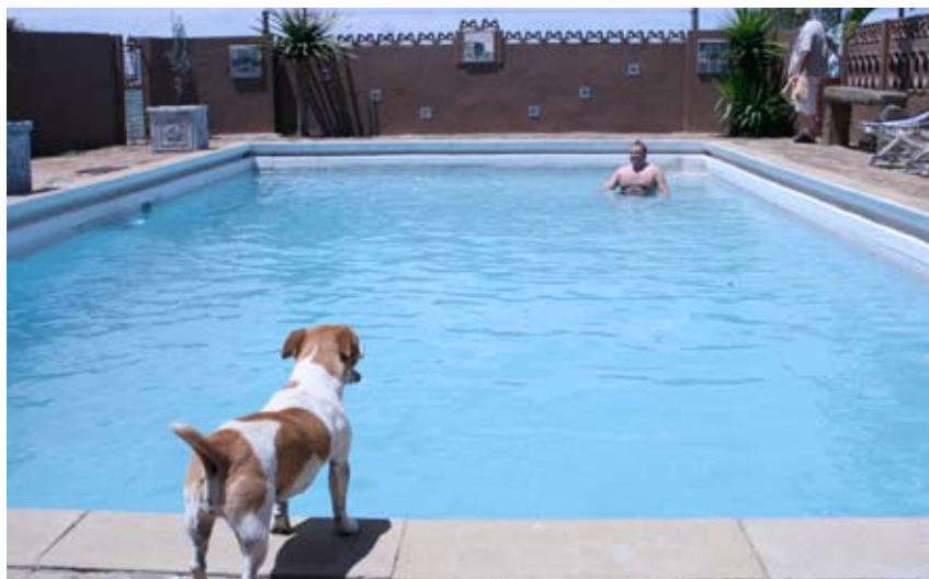
Mellom spennende jaktøkter fristes både to- og firbeinte til en dukkert i et rent og velfyllt svømmebasseng.