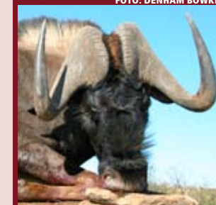
Sondra Chancellor fra USA kan ha satt ny verdensrekord for black wildebeest med dette uvanlig store trofeet hun sikret seg på Thorn Kloof