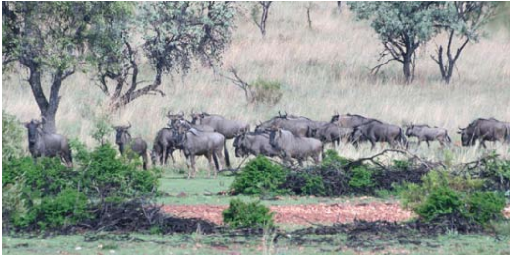
Under jaktene i Eastern Cape er det store sjanser for spennende jakter på black wildebeest (gnu).

titalls hinder. Nå som det snart er tid for kalving, kan både bukker og hinder opptre i separate småflokker.