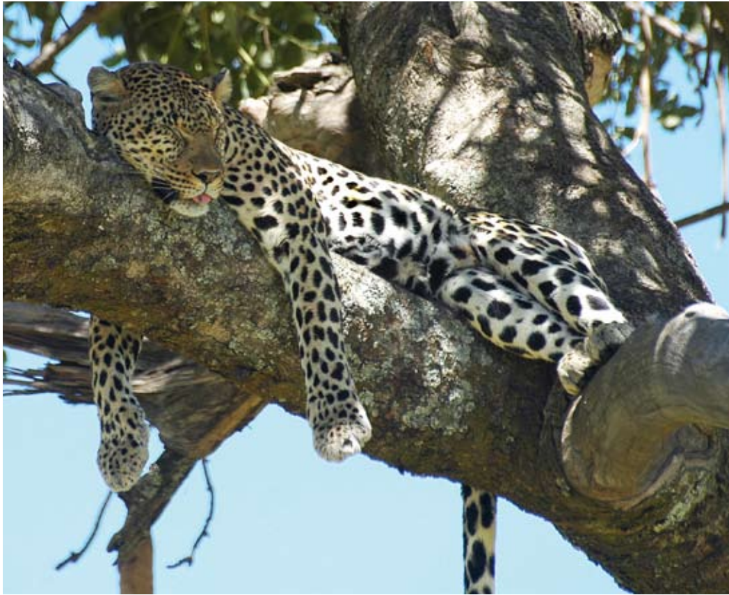
I motsetning til den gaupeliknende caracalen, er leopard et sjeldent innslag i Eastern Cape. Dette individet «forsov» seg da jegere på fotosafari passerte under hviletreet!

– Har dere lyst til å dele en flaske Barolo med meg?